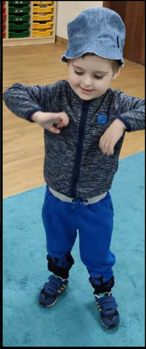
Optymiści jako aktorzy teatralni. Właśnie przygotowują się do spektaklu, w garderobie trwa przymierzanie strojów 😊.