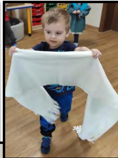
Przebieranie, zabawa w aktorów miała niesamowite wzięcie 😊.