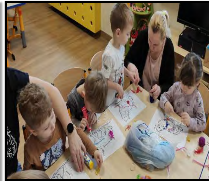
Wilk zamienił się kolorowego zwierzaka – cudaka.