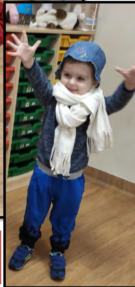
A co tu się dzieje?! kolejny bal karnawałowy, a może wybieg mody wiosna – lato 2022???? ☺.