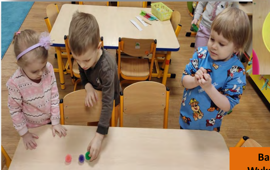
Barwiliśmy ryż teraz mamy w kilku kolorach, nie tylko biały. Wykorzystujemy go do zabaw sensorycznych, prac plastycznych.