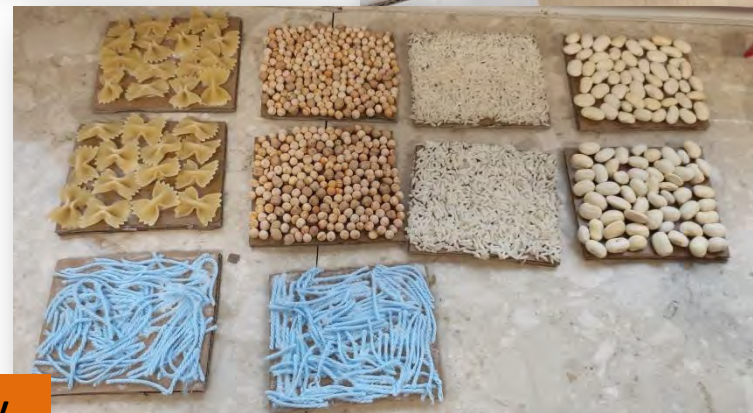
Zrobiliśmy sensoryczne - dotykowe memory.