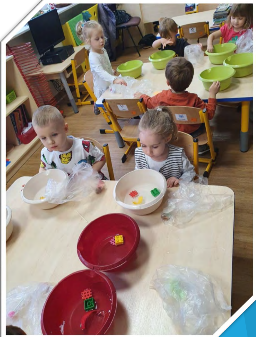
Sprawdzaliśmy co pływa, a co tonie.