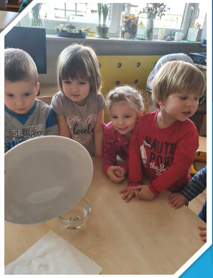
I udało się – oto nasz deszcz ☺