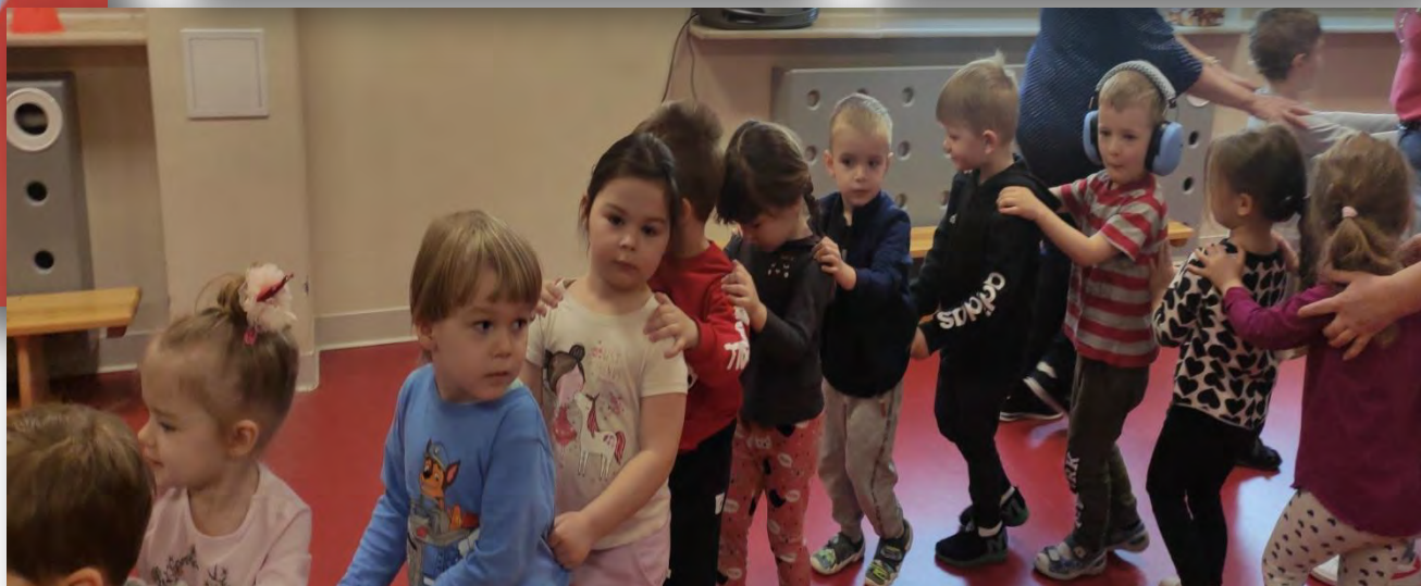
Karuzela, karuzela na Bielanych co niedziela. Śmiechu becinka i wesela, a muzyczka, muzyczka nam gra.