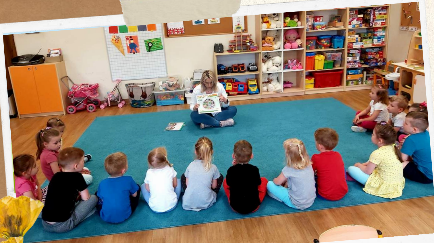
Spotkanie z Panią dietetyk