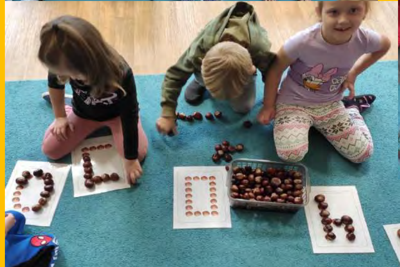
Utrwaliliśmy orientację przestrzenną i odwzorowywaliśmy różne wzory.