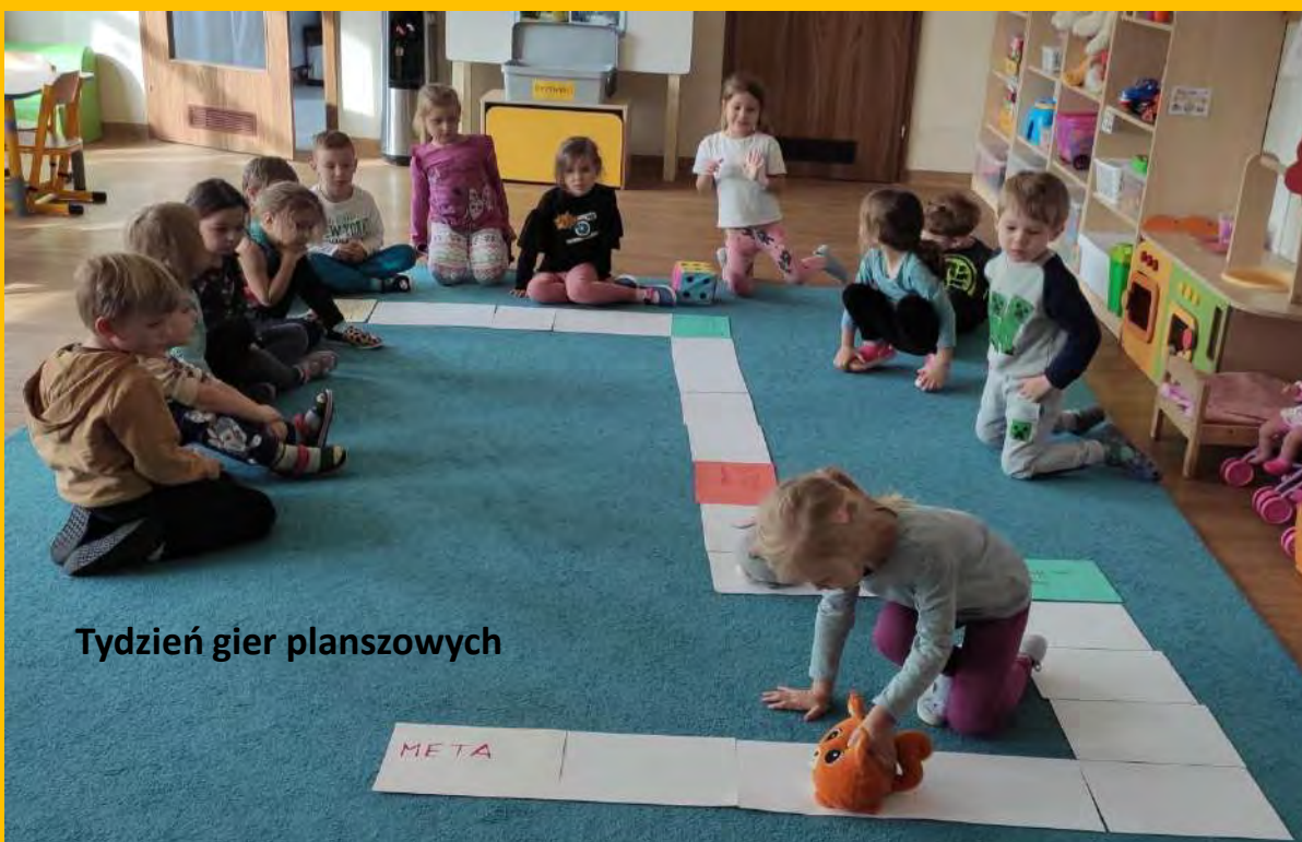
Tydzień gier planszowych